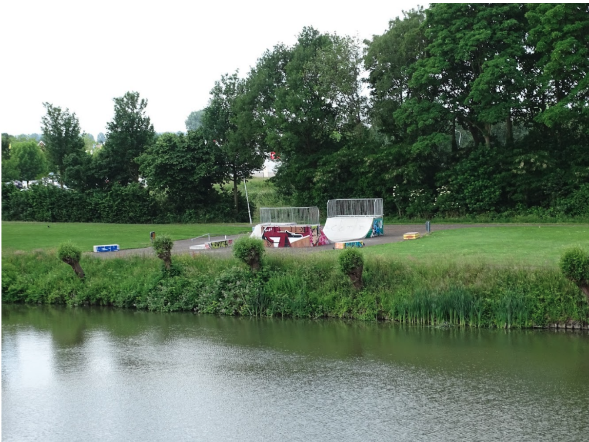
Afbeelding 6: skatepark Hulst