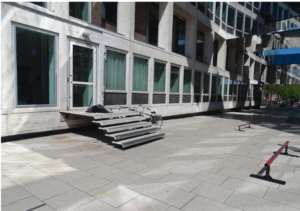
Afbeelding 5: Plein en trap voor het provinciehuis Gelderland geschikt voor skaten, Arnhem

Als u nog meer voorbeelden kent van gemeenten met beleid voor urban sports, laat het ons weten. We zijn vooral geïnteresseerd in voorbeelden van gemeenten die urban sports geïntegreerd hebben in zowel hun sociaal als ruimtelijk beleid (bijvoorbeeld Copenhagen, Denemarken).