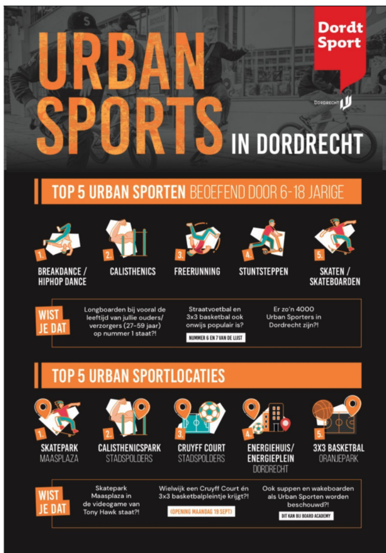
Afbeelding 1: infographic urban sport Dordrecht