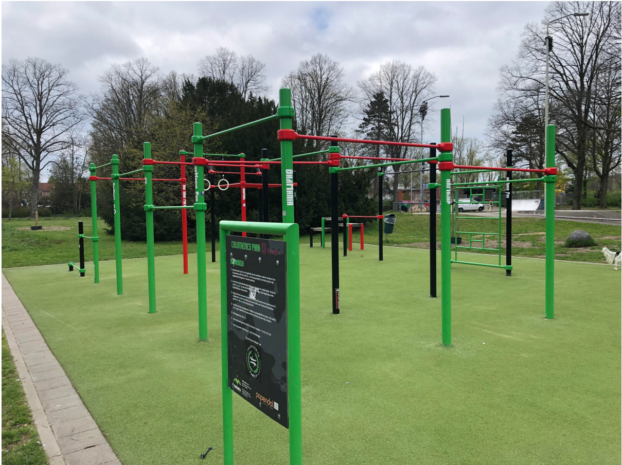
Afbeelding 2: Calisthenics park bij Goffertpark, Nijmegen