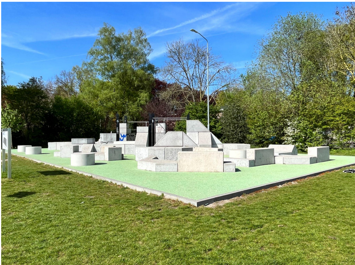
Afbeelding 4: Urban sportpark Eindhoven

Om beter inzicht te krijgen in het beweeg-effect van het Urban Sportpark deed Eindhoven kwalitatief en kwantitatief onderzoek naar het gebruik van het park. Gedurende een jaar is er gemeten met zes sensoren bij alle ingangen van het park. Die meten hoeveel mensen op welk moment het park bezoeken. Met (live) dashboards zijn piekuren en trends bepaald (rekening houdende met jaargetijden en weersomstandigheden). Uit de eerste meting bleek dat het park in 2,5 maand zo'n 36.500 bezoekers trok. Gemiddeld waren er 490 bezoekers per dag met een piek op zondagmiddag rond 15:00 uur.