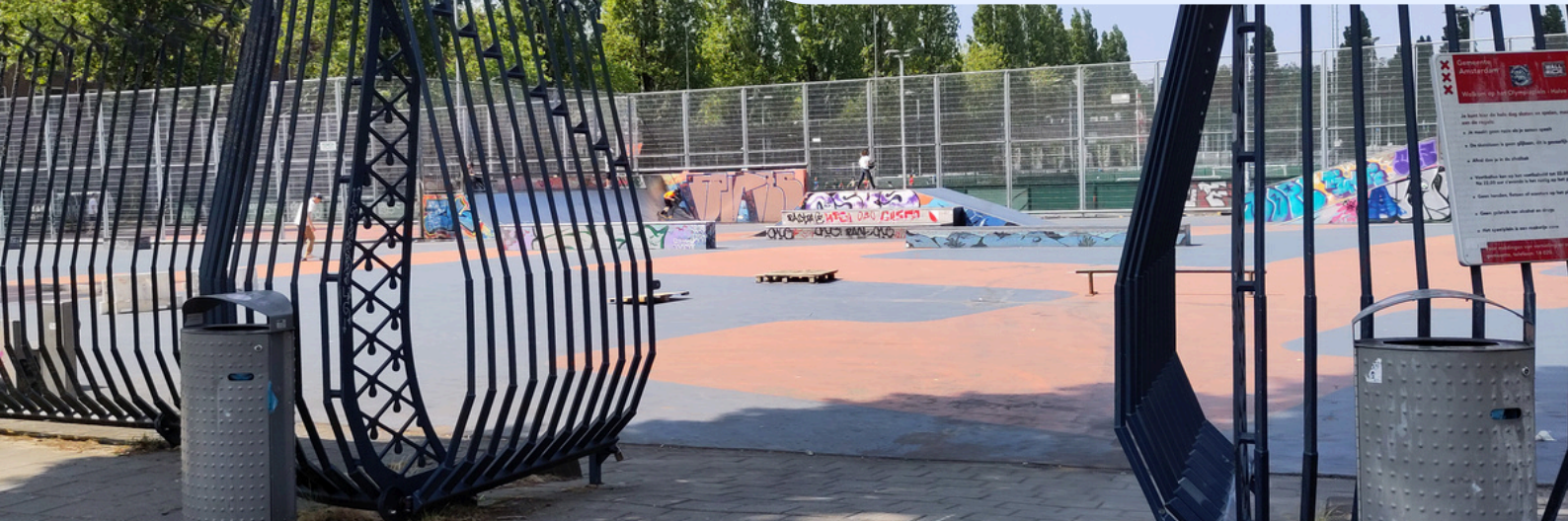
Afbeelding: Skatepark Amsterdam

Atencio et al. [9] stellen dat de media, de “doe-het-zelf-cultuur” en ‘leefstijl/actiesporten’ genderverschillen in skateboarden in stand houden. Risicogedrag en technische bekwaamheid van deze actiesporten worden als mannelijk beschouwd en vooral bij skateboarden beloond met complimenten, aanzien, vrienden, views, likes, (media) aandacht, etc. Jonge mannelijke skaters ondersteunen in theorie de meiden, maar realiseren zich niet altijd dat ze ook problemen veroorzaken [10], meiden ervaren namelijk: