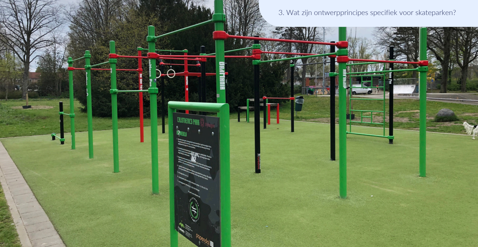
Afbeelding: Calisthenics en skate park Nijmegen