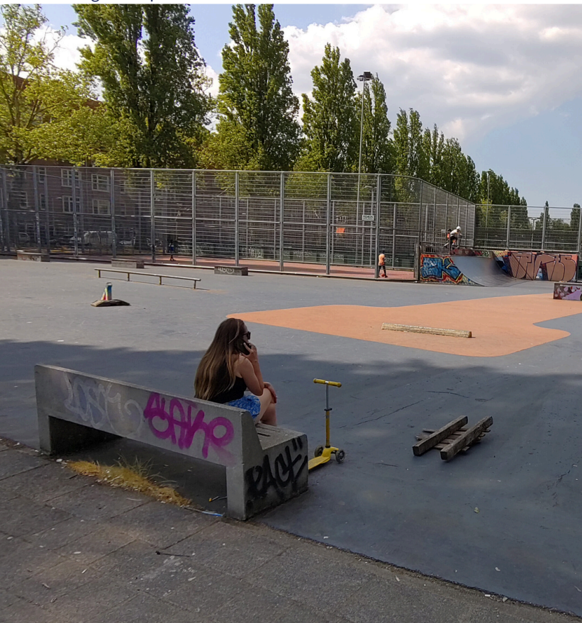
Afbeelding: Skatepark Amsterdam