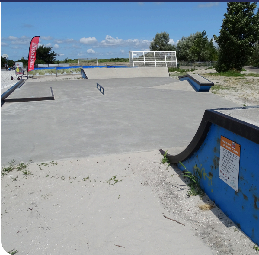
Afbeelding: Skatepark Makkum