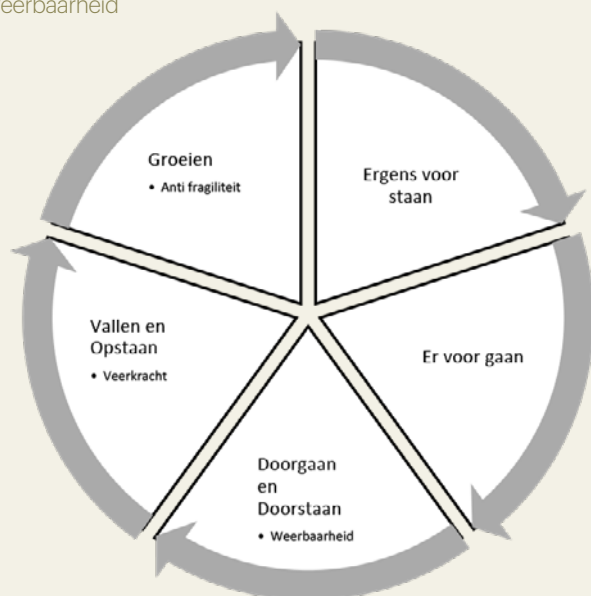
Figuur 1 Weerbaarheid

Er wordt veel gesproken over mentale weerbaarheid. Alsof dat los staat van