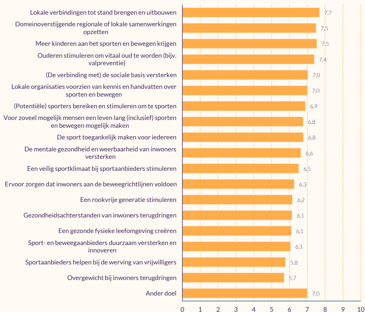
Figuur 4.1 Resultaten* geboekt op de doelen (volgens buurtsportcoaches) (gemiddelden, n=74)