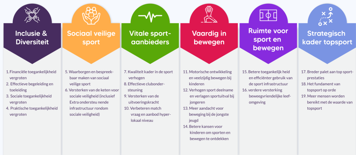
Figuur 1.1 Sportakkoord II: thema's en opgaven

Per thema zijn twee tot vier opgaven geformuleerd. In totaal zijn er negentien opgaven (zie figuur 1.1 ). In de vorige voortgangsrapportage (Hoogendam et al., 2024) staat de achtergrond van SAI1 nader toegelicht.