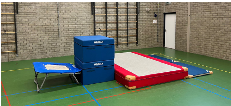
Afbeelding 8 Dubbele blok in de lengte met plank