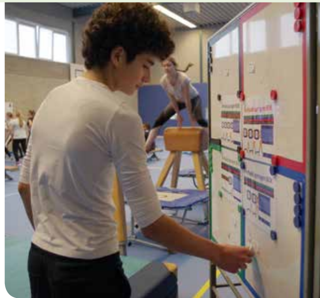
▲ Leerling niveau inschalen herhaald springen

Er zijn twee rubrics ontwikkeld om leerlingen handvatten te geven om hun houding (attitude) te ontwikkelen. De inzet van de rubrics werkte. Minder leerlingen zaten 'geblesseerd' aan de kant en minder leerlingen hadden hun spullen 'vergeten'. Er werd zichtbaar met veel meer plezier, actiever en beter bewogen. Ook verbeterde de sfeer bij de leerlingen onderling. Eind 2017 werd ik lid van het Ontwikkel Team (OT) Beweging&Sport van curriculum.nu. Omdat er ook ontwikkelscholen (OS) gevraagd werden, heeft ook de vakgroep (inmiddels omgedoopt tot) Bewegingsonderwijs zich hiervoor aangemeld. Naast het geven van periodieke feedback op de tussenproducten van het OT, werd er ook een product van de OS gevraagd. Via curriculum.nu was er veel tijd beschikbaar om de manier van evalueren verder te ontwikkelen.