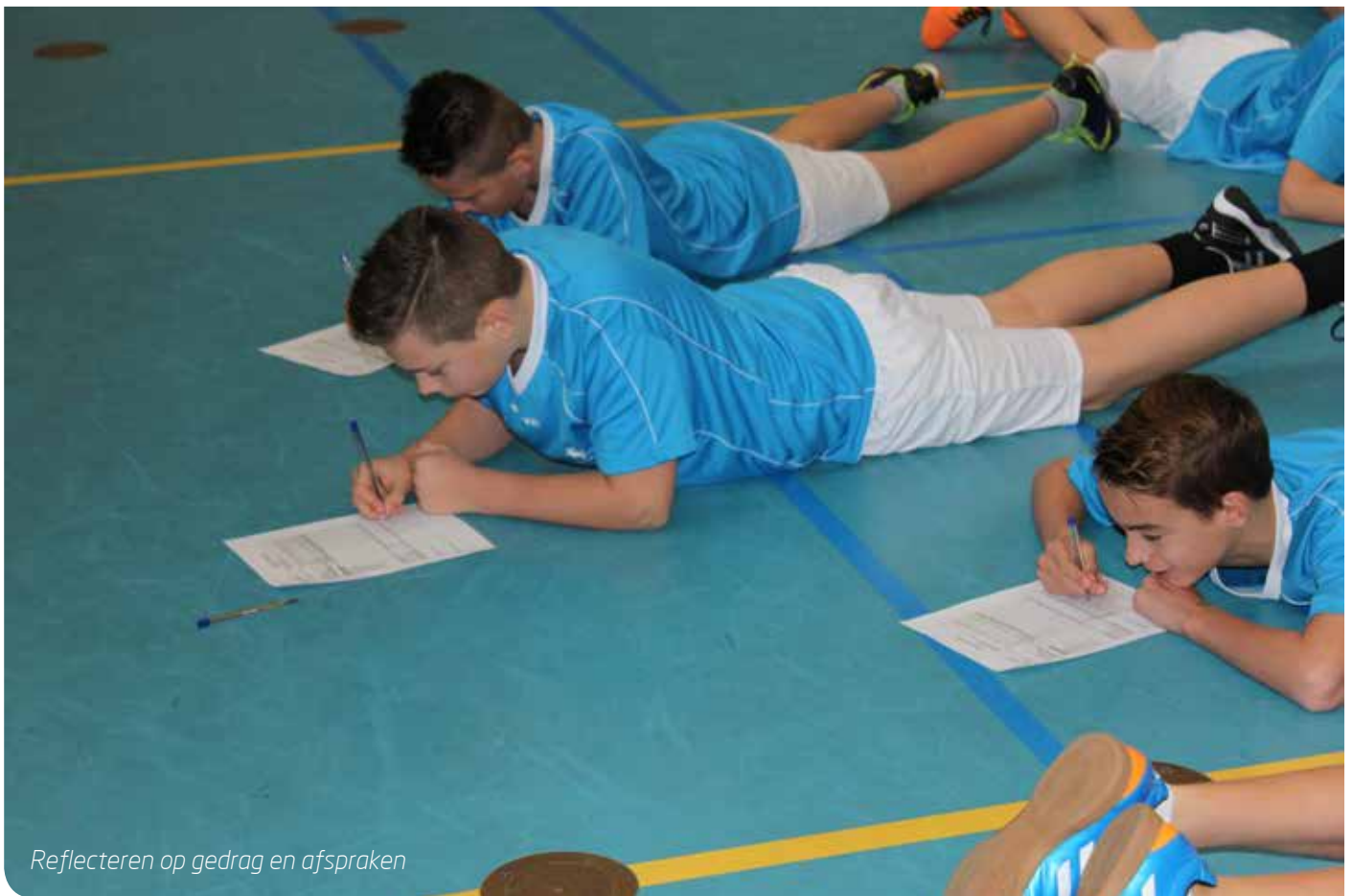
Reflecteren op gedrag en afspraken

gehandhaafd. Deze afspraken gelden echter, ook al zijn ze formeel nog niet vastgesteld, vanaf de allereerste minuut: te laat is te laat.