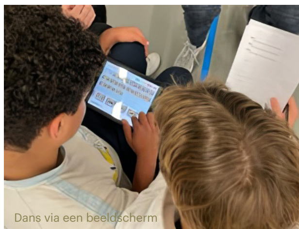
Dans via een beeldscherm

Veel jongeren zijn actief met dansjes via TikTok waar ze dansjes nadoen op muziek en met elkaar delen.