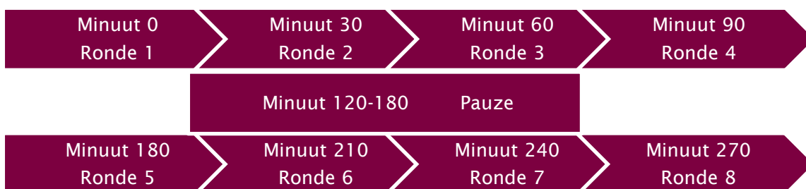
Figuur 2.3 Visuele weergave van een observatie

De observant noteert de SOPLAY-gegevens voor elke zone apart. Deze gegevens voert de observant in de app Numerare in, waarin we het observatieformulier SOPLAY in een online variant hebben nagemaakt. Een gehele observatie houdt in dat een observant alle zones acht keer observeert (figuur 2.3). Elk half uur loopt de observant alle zones langs en noteert deze per zone alle gegevens. Na vier rondes heeft de observant een uur pauze. Op een weekdag vindt de observatie plaats van 15.00-20.00 uur, op een weekenddag van 10.00-15.00 uur. We hebben beide playgrounds op vier dagen geobserveerd: drie weekdays en één weekenddag.