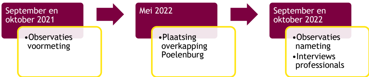
Figuur 2.1 Tijdlijn en methode onderzoek

Om de onderzoeksvragen te beantwoorden hebben we in dit onderzoek twee methoden gebruikt: observaties en interviews. Met observaties hebben we voor en na de plaatsing van een overkapping het gebruik van de playground in kaart gebracht. Op dezelfde momenten brachten we ook het gebruik in kaart van een playground in de buurt waar geen verandering plaatsvond (de 'controleplayground'). Daarnaast hebben we in de periode van de nameting twee interviews gehouden: met een jongerencoach en een coördinator sportwerk. In figuur 2.1 is de tijdlijn van het onderzoek te zien. Met deze methoden kunnen we alle deelvragen beantwoorden.