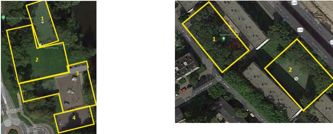
Figuur 2.2 Indeling Playground Poelenburg (links) en Playground Hofwijk (rechts) in zones

Voor het observeren van de playgrounds in Zaandam hebben we deze allereerst in zones ingedeeld. Voor Playground Poelenburg is zone 1 de daadwerkelijke Playground, waar een overkapping op is geplaatst. Voor Playground Hofwijk is zone 2 de daadwerkelijke Playground. Omdat de gehele speelplek groter is, hebben we ook de andere zones op de speelplek geobserveerd.