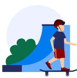
Sport- en speelplekken