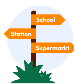
Nabijheid van voorzieningen

Op elke deelindicator kan tussen de 0 en 100 punten worden gescoord. De gemiddelde score van de vier deelindicatoren vormt de score van de KBO.