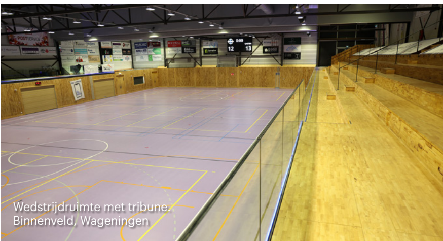
Wedstrijdruimte met tribune. Binnenveld, Wageningen

Inrichting en inventaris worden compact beschreven onder verwijzing naar bijlagen met inventarislijsten (modellen en toepassingen). Dit betreft de wedstrijdruimte(n). Het is verstandig om de vaste inrichting en de losse inventaris te regelen via een directievering. Een gespecialiseerde leverancier levert de inrichting en inventaris aan de opdrachtgever en niet indirect via de aannemer. Goede beschrijvingen van de benodigde inrichting en inventaris zijn essentieel. Zie afleveringen 16 tot en met 19 van deze serie voor meer informatie over dit onderwerp. Afstemming van inrichting en inventaris op sportvloer en belijning en op bouwkundige aspecten is een voorwaarde voor een optimaal resultaat.