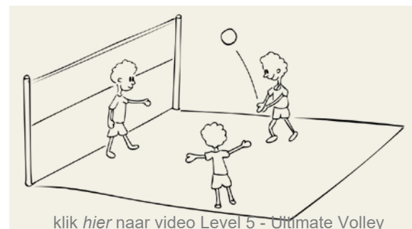
Figuur 5 Level 5 - Ultimate Volley (club 10-12 jaar)

klik hier naar video Level 5 - Ultimate Volley