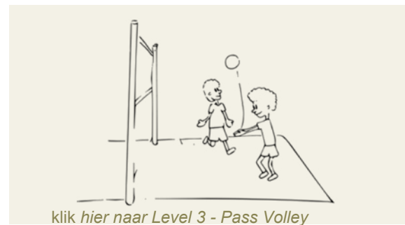
Figuur 3 Level 3 - Pass Volley (club 8-10 jaar)

is het idee van spel gecentreerd leren. Het woord zegt het al, het spel staat centraal. En leren in het spel is het meest relevant om tot een spelontwerp te komen (Koekoek et al., 2023). Dit wordt vanuit internationaal perspectief ook wel een game-based approach genoemd (Pill et al., 2023). Het is een vakdidactische benadering waarbij het ontwerpen van leerrijke omgevingen centraal staat. Met het op maat maken via ontwerp is het ultieme doel dat kinderen in de volle betekenis van het spel ervaren wat er nodig is om de uitdaging in het spel steeds beter op te lossen (Walinga & Koekoek, 2023). In het volleybal is die uitdaging vooral gericht op het plaatsen van de bal op de grond van de tegenstander, om tegelijk als