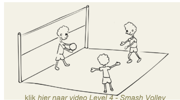
Figuur 4 Level 4 - Smash Volley (club 9-11 jaar)

klik hier naar video Level 4 - Smash Volley