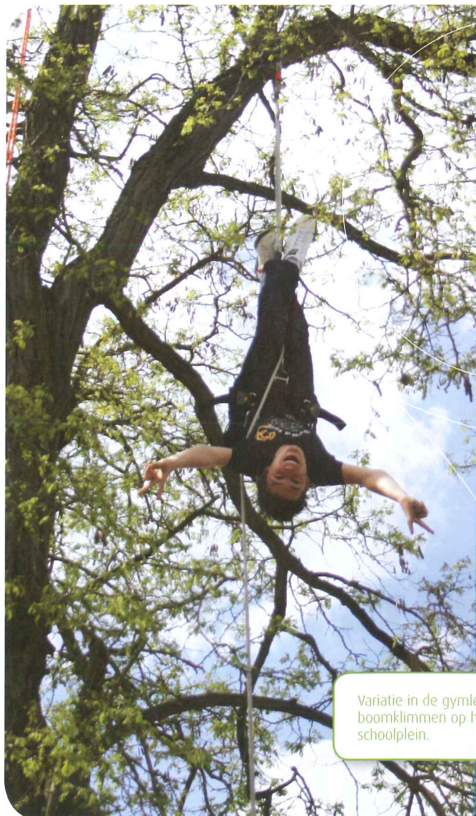
Variatie in de gymlessen: boomklimmen op het schoolplein.

De mate van plezier is bepaald aan de hand van stellingen als: >>