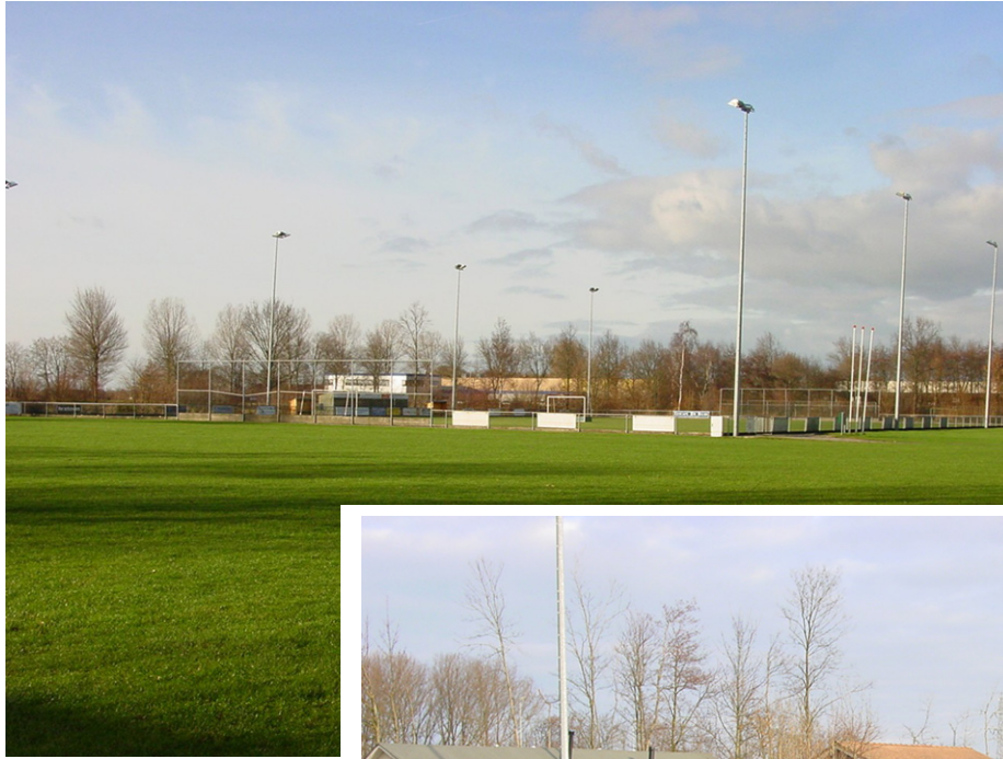
Sportpark Tussenboerslanden in Nijveen (boven) en rechts de atletiekbaan op het sportpark Ezinge