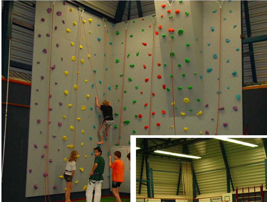
Sportbehoeften veranderen: een klimwand in de sporthal Het Vledder en bowls; een sport die onder senioren aan populariteit wint.