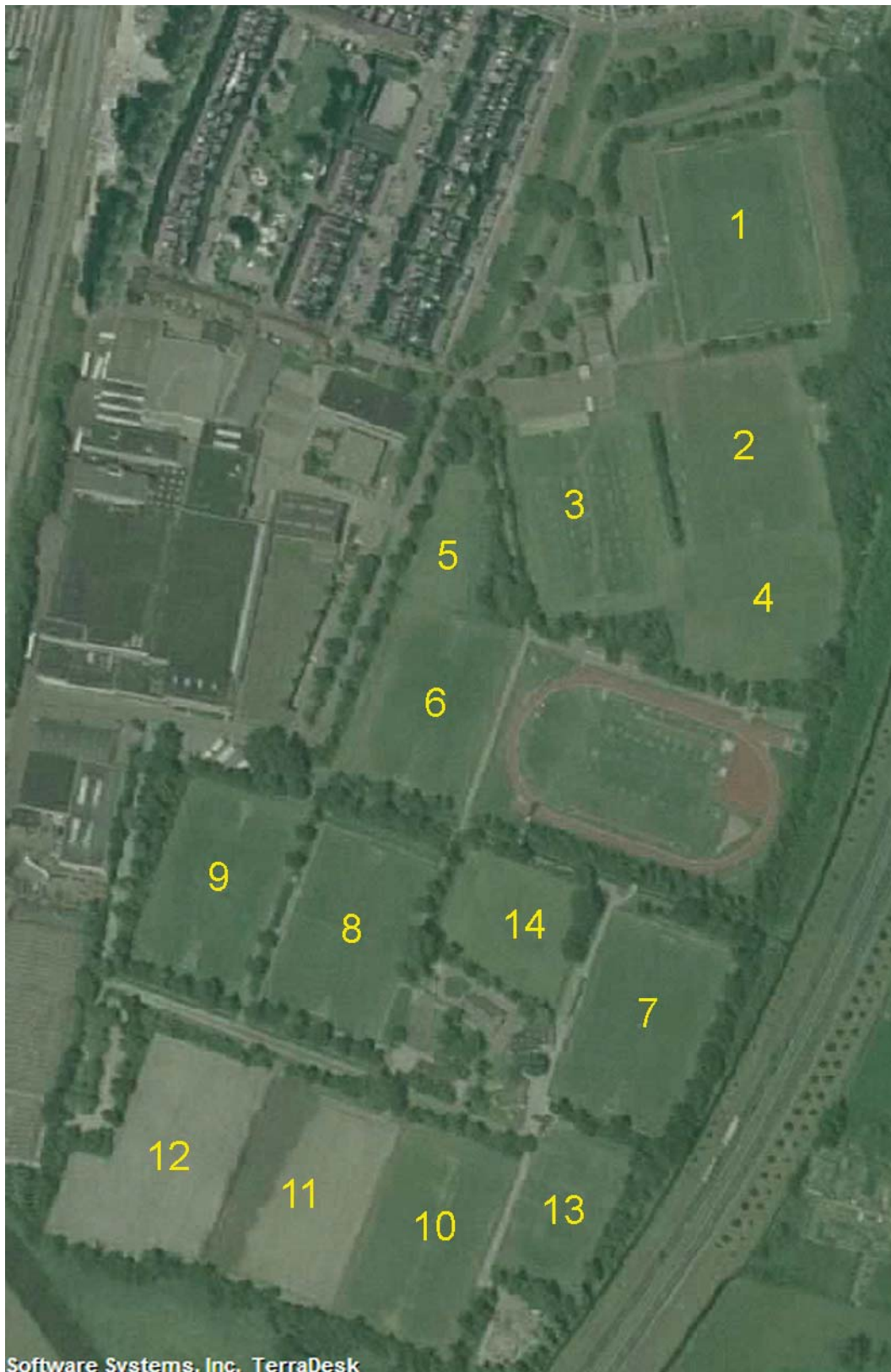
Afbeelding 5.1 Sportpark Ezinge (luchtfoto 2003)

FC Meppel beschikt over drie wedstrijdvelden (waarvan 1 Wetra veld) en 1 trainingsveld. FC Meppel is een zaterdagvereniging, dat betekent dat zowel pupillen, junioren als senioren op de zaterdag hun wedstrijden afwerken (in tegenstelling tot Alcides en MSC waar de senioren zondag spelen). Volgens