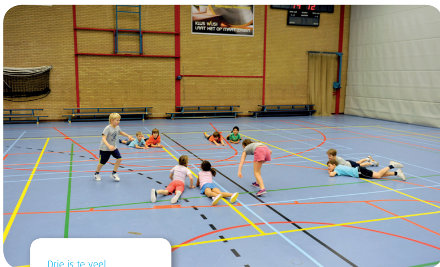
Drie is te veel

Het klinkt misschien vergezocht maar probeer het eens uit! Negeer die ene leerling die stilstaat, geef geen aandacht aan leerlingen die zich laten tikken, complimenteer de tikker en geef eens een high