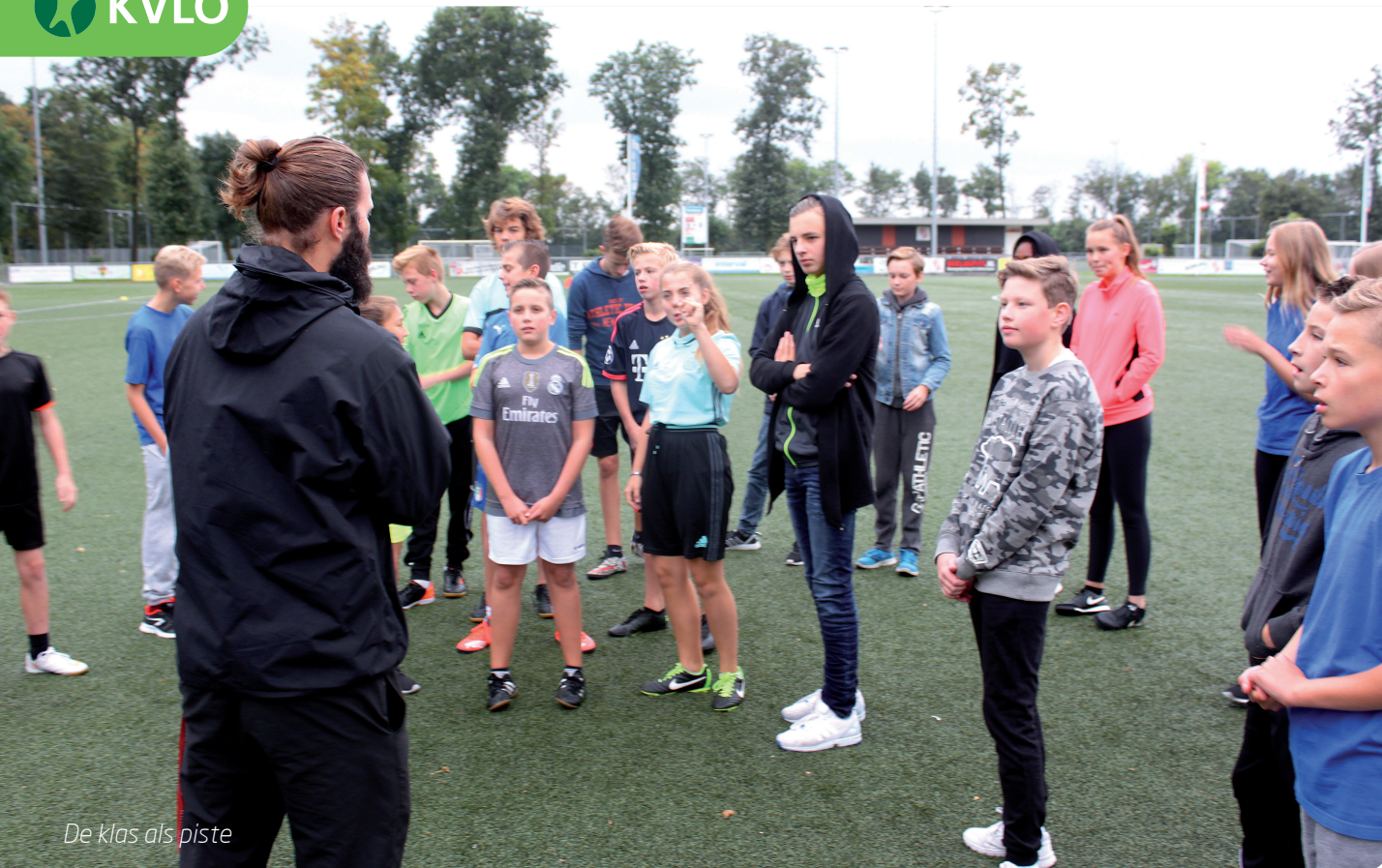
De klas als piste