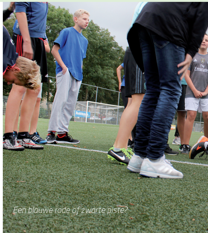
Een blauwe rode of zwarte piste?

dan aan de orde komen: Hoe wil jij als lesgever een niveau 1,2 of 3 beweging begeleiden en hoe wil jij als lesgever zelf begeleid worden? De (stage)begeleider zal eerst kunnen onderzoeken wat de pistekleur is van de klas en welk lesgeefniveau de lesgever heeft voordat er begeleiding op maat gegeven kan worden. Dit artikel gaat vooral over de lesgeefcontext waarin het begeleiden plaatsvindt en niet over de wijze van begeleiden.