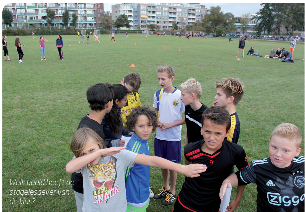
Welk beeld heeft de stagelesgever van de klas?