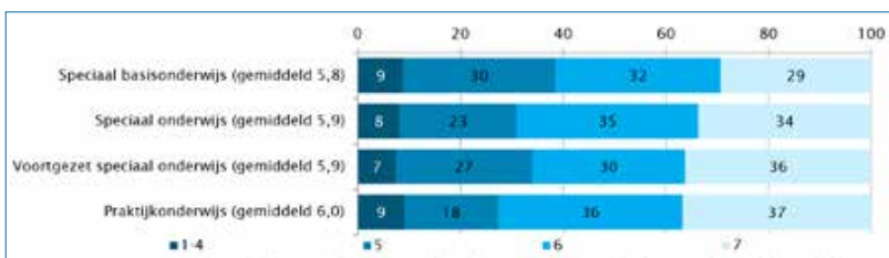
▲ Figuur 3: Mate van persoonlijke aandacht voor leerlingen op een schaal van 1 (onvoldoende) tot 7 (voldoende) volgens schoolleiders in 2019 (in procenten)

Vrijwel alle schoolleiders zijn van mening dat de bewegingsactiviteiten worden aangepast aan het niveau van de leerlingen. De mate van persoonlijke aandacht voor leerlingen bij het vak in het speciaal onderwijs is gemiddeld hoog te noemen: de gemiddelde score op een 7-puntschaal is voor het speciaal basisonderwijs 5,8; voor speciaal onderwijs 5,9; voor voortgezet speciaal onderwijs 5,8 en voor praktijkonderwijs 6,0 (figuur 3). Van de scholen voor praktijkonderwijs schenkt 60 procent bij het vak veel aandacht aan leerlingen met gedragsproblemen (niet in figuur).