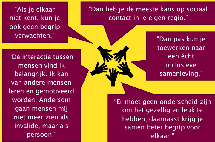
Figuur 4 Uitspraken van actieve mensen met een beperking over het belang van ontmoetingen tussen mensen met en zonder beperking