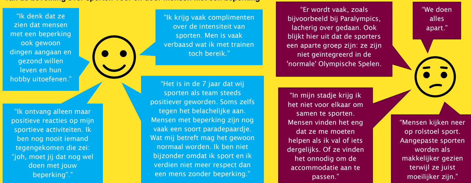
Figuur 3 Uitspraken van sportief actieve mensen met een beperking over de positieve (links) en negatieve (rechts) houding van de bevolking over sporten voor en door mensen met een beperking