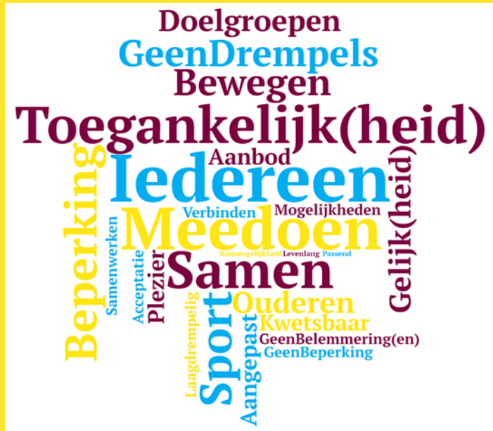
Figuur 1. Associaties bij een inclusieve samenleving: 25 meest genoemde woorden door ambtenaren sport en bewegen (855 woorden, n=179)