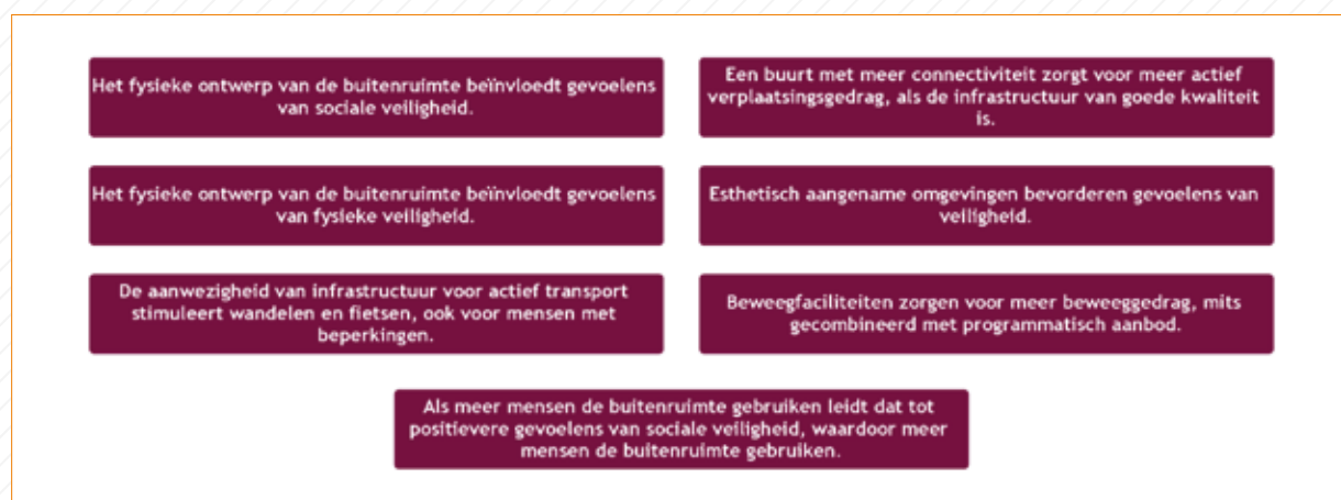
FIGUUR 1 ZEVEN WERKZAME ELEMENTEN VAN EEN BEWEEGVRIENDELIJKE OMGEVING.

werkzame elementen, is dat de beweegvriendelijke leefomgeving niet alleen het sportdomein raakt. Ook andere beleidsdomeinen, zoals ruimtelijke ordening, veiligheid, woningbouw, groen en het sociale domein, zijn noodzakelijk voor het succesvol organiseren van de beweegvriendelijke buitenruimte. Een beweegvriendelijke omgeving kan dan ook alleen gerealiseerd worden als verschillende afdelingen binnen het gemeentehuis goed samenwerken en hun beleid en uitvoering afstemmen.