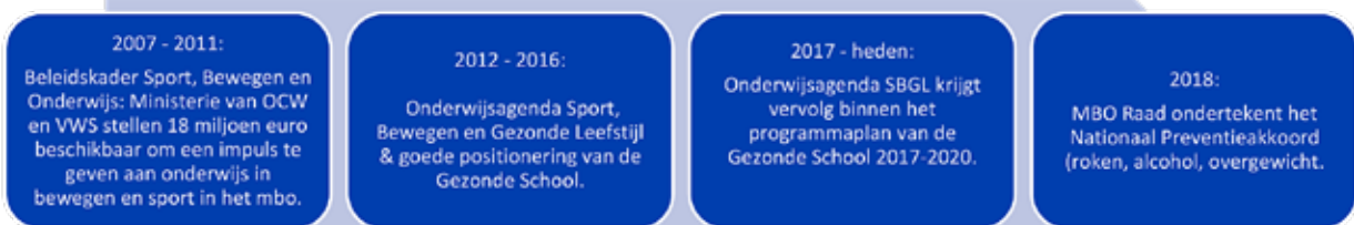
Figuur 1. Ontwikkelingen in het mbo (2007 tot nu)

Al met al lijken de drijfveren voor het aanbieden van sport- en beweegaanbod bij mbo-locaties te verschuiven van sport- en beweegstimulering naar bredere gezondheidsbevordering. Over het algemeen lijkt de aandacht voor het beweeg- en sportaanbod op mbo-locaties wat te verslappen. Dit blijkt bijvoorbeeld uit de verschuiving in de hoeveelheid aandacht die bepaalde gezondheidsthema's krijgen op mbo-locaties: bewegen en sport was in 2016 (56%) vaker in het centrale beleid verankerd dan in 2020 (39%). Sinds 2016 is weinig verandering te zien bij het behalen van de vijfprocentnorm 2 . Het deel van de scholen dat aangeeft aan deze vijfprocentnorm te voldoen voor de eerste twee leerjaren, is tussen 2016 en 2020 zelfs licht afgenomen (van 61% naar 53%) 1 . Tot slot geeft een derde (30%) van de respondenten