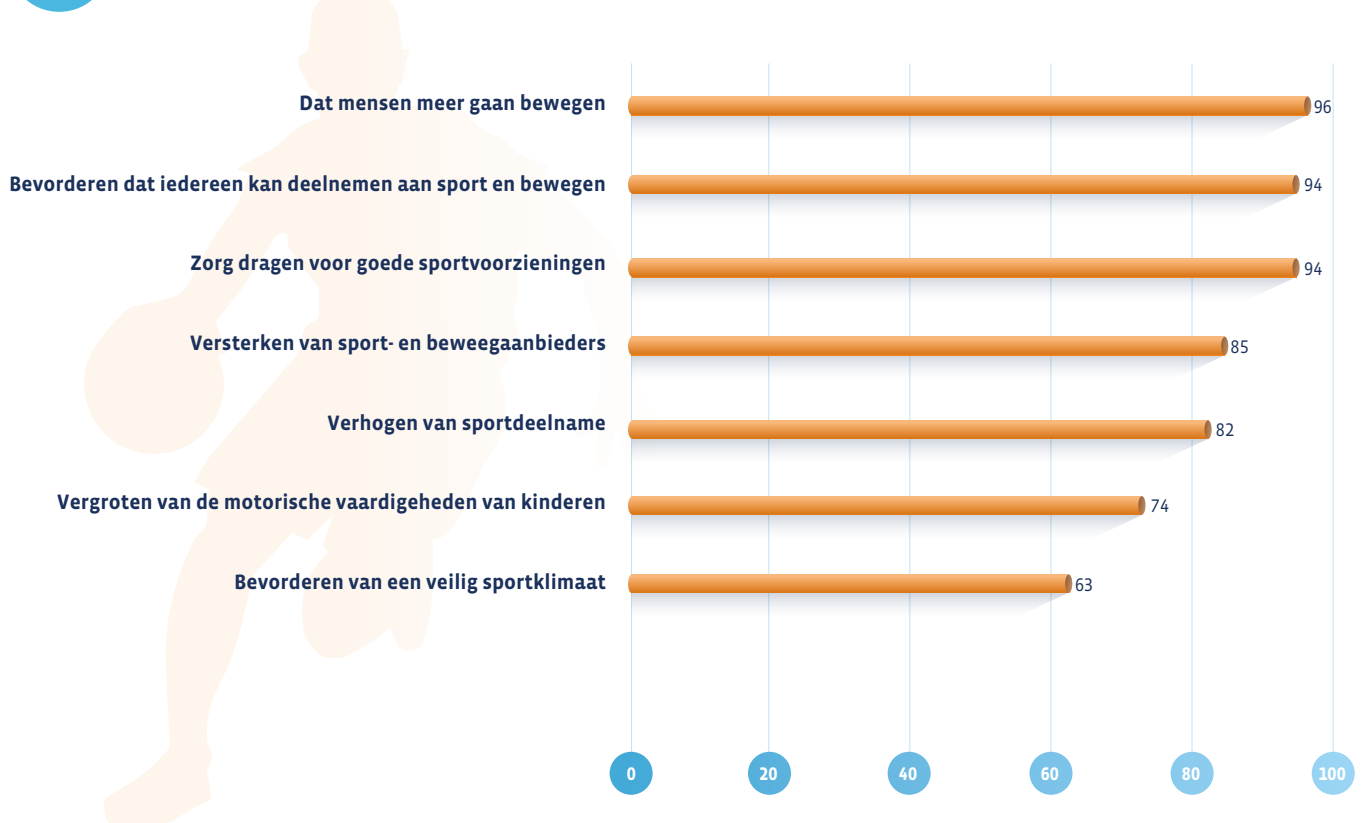
Figuur 1 Wat gemeenten willen bereiken met het sportbeleid voor de sport zelf (in procenten, meerdere antwoorden mogelijk, n=144)

Het bevorderen van de gezondheid en de sociale participatie en integratie zijn veruit de belangrijkste maatschappelijke doelstellingen. ◀