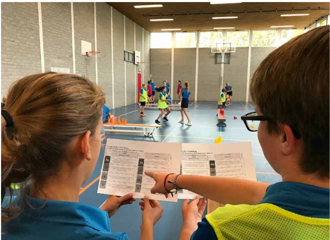
▼ Foto 1: Twee leerlingen gebruiken de rubric “doelspelen klas 1” (De Nassau, 2018)

Aan hand van dit onderzoek, maar ook onze ervaringen als vakgroep, komen we tot de volgende conclusies. Een formatieve werkwijze past het beste bij de leerlingen (en docenten) op De Nassau. Het geeft de leerlingen en docenten veel structuur en geeft tegelijkertijd ook transparantie. Rubrics zijn voor ons een krachtig onderwijskundig hulpmiddel gebleken dat leidt tot een hoger gevoel van monitoring,