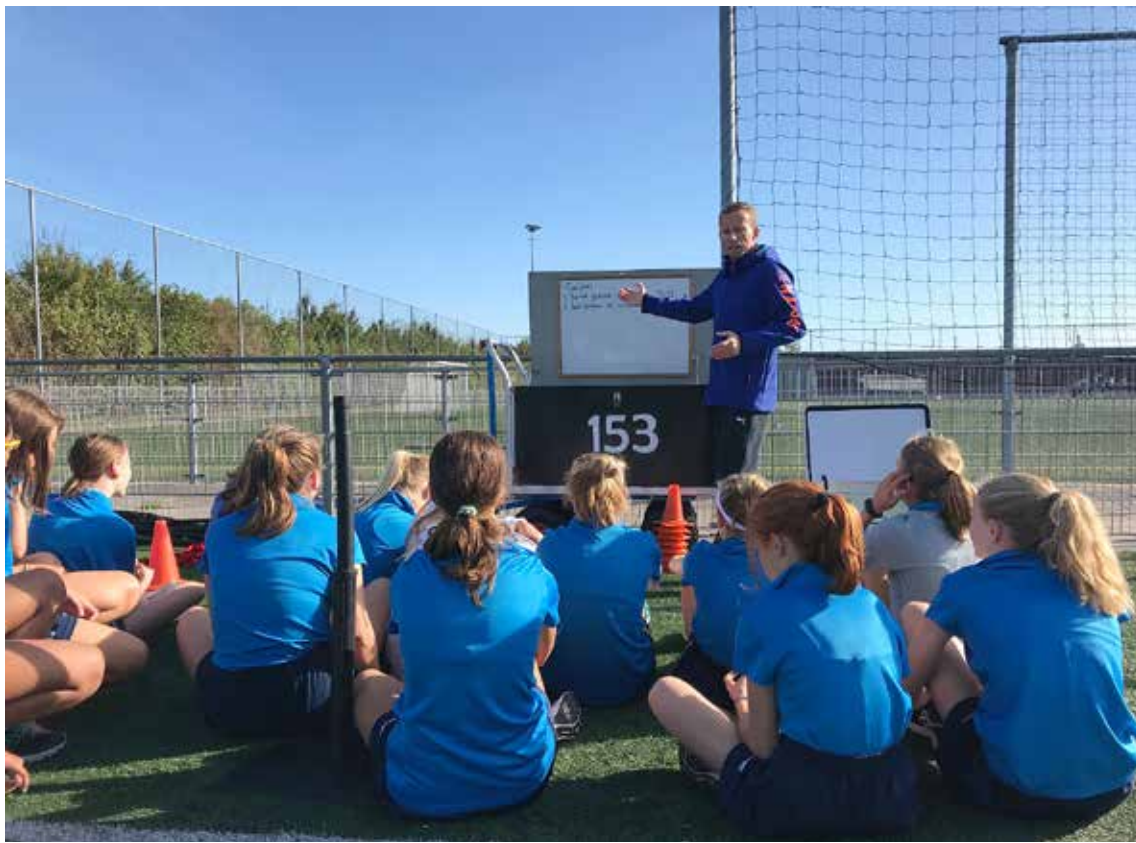
◀ Foto 2: Het expliciet maken van leerdoelen (feed-up) (De Nassau, 2018).

scaffolding, autonomie en autonome motivatie. Leerlingen ervaren de werkwijze als heel prettig. De leerdoelen binnen onze lessen liggen zowel op motorisch als tactisch gebied, waarbij enkele rubrics tevens sociale elementen bevatten (zoals coaching) (afbeelding 1). Voor alle leerlingen is er voldoende ruimte om op hun eigen niveau te presteren, zonder de druk van het krijgen van een cijfer. We hebben als vakgroep echt gemerkt dat leerlingen gemotiveerd zijn om goed te scoren op de rubric, ook al telt deze niet mee.