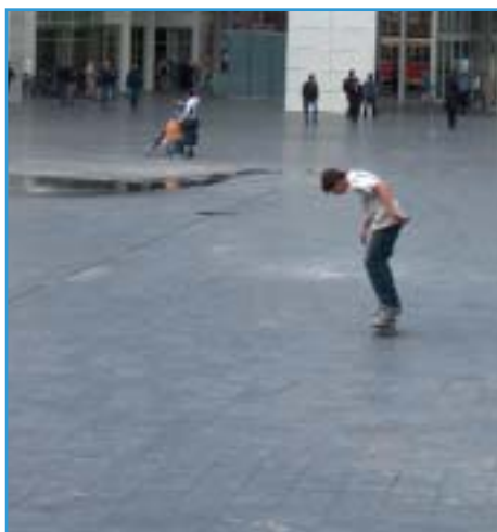
Afbeelding 7 + 8. Spuiplein