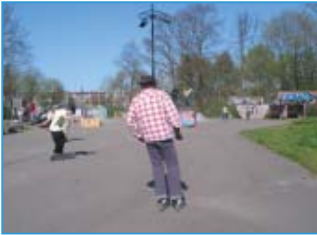
Afbeelding 9. Zuiderpark