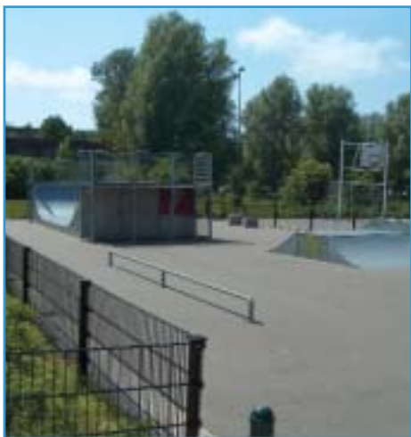
Afbeelding 5. De Gaarde

Daarnaast is er overlast mogelijk door het hinderen van andere gebruikers van de openbare ruimte. Bij de aanleg van een skatevoorziening moet dan ook rekening gehouden worden met de verschillende groepen die van de ruimte rond de locatie gebruik maken. De skateplek dient zo ingericht te worden dat er geen conflicten met medegebruikers van de openbare ruimte ontstaan.