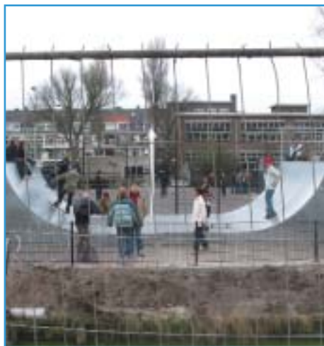
Afbeelding 6. Pomonaplein