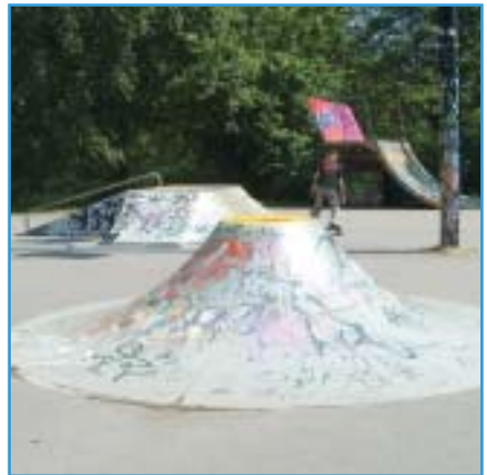
Afbeelding 2. Een skatepark (Zuiderpark)