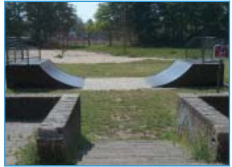
Afbeelding 10. Bokkefort, voorbeeld van een op zichzelf staande skatevoorziening die niet voldoet aan het PvE en in aanmerking komt voor de samenvoeging