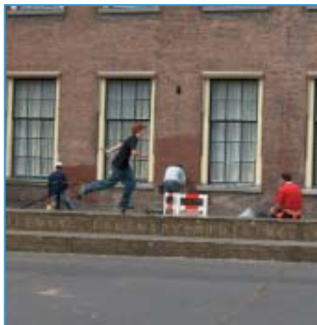
Afbeelding 4. Hofplaats