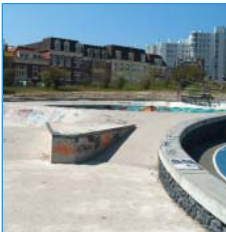
Afbeelding 3. Badhuiskade/Havenkade