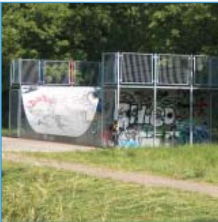
Afbeelding 1. Een op zichzelf staande skatevoorziening