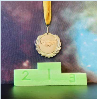
3D-geprint prijzenpodium, gemaakt en ontworpen door leerlingen D&P.

Eén van de eindtermen van OSBA is deeltaak 11.2: Voor een doelgroep een eenvoudig sportevenement of toernooi organiseren en uitvoeren. Binnen de organisatie van de sportdag is deze eindterm een goed voorbeeld van 'leerstof' welke aan bod komt. Waar leerlingen nu nog vaak aan fictieve activiteiten werken, bieden deze activiteiten een fantastische uitdaging voor de leerlingen en voor de docenten. Docenten Lichamelijke Opvoeding (LO) en docenten D&P kunnen als opdrachtgever fungeren en daarmee de leerlingen een verantwoordelijkheid geven voor het uitvoeren van de organisatie, de promotie, het fabriceren van de noodzakelijke hulpmiddelen en het maken van een multimediale productie van deze activiteit.