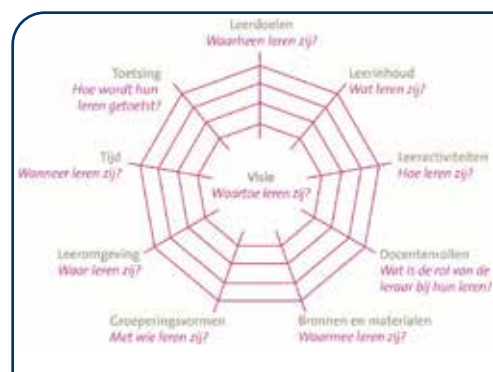
Figuur 1: Het curriculaire spinnenweb

van stichting, richting en inrichting van het onderwijs wordt geregeld. Dat artikel is typisch voor Nederland en zorgt ervoor dat de overheid zeer terughoudend moet zijn met voorschriften (zoals kerndoelen) voor het onderwijs. Curricula kennen ook meerdere componenten. Zie figuur 1, het curriculaire spinnenweb. Een herijking van kerndoelen zoals nu met Curriculum.nu heeft alleen betrekking op doelen en inhouden, het 'waarheen' en het 'wat' van het curriculum. Tenslotte kent het curriculum meerdere verschijningsvormen. Het begint met een idee, een visie, die op papier gezet moet worden, geïnterpreteerd door scholen en docenten en omgezet in onderwijsactiviteiten, methoden, didactiek, toetsing, et cetera. Leerlingen tenslotte geven daar op hun eigen manier betekenis aan en dat allemaal leidt tot bepaalde leerresultaten. In de praktijk kan er dus een flink gat zitten tussen het beoogde en het gerealiseerde leerplan.