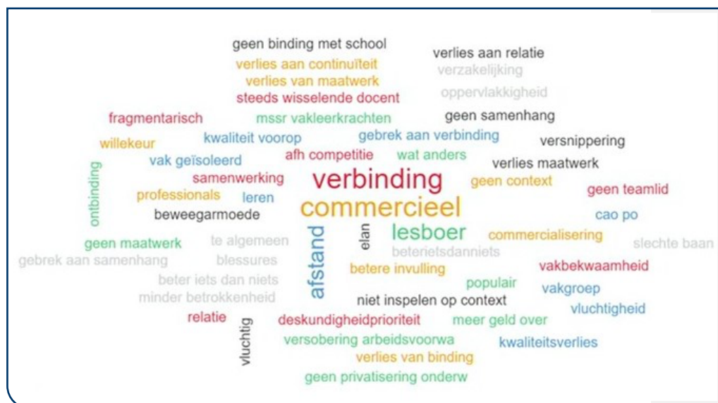
► Figuur 4: Woordveld invloed inkopen bewegingsonderwijs bij sportservicebureaus.

Na de inleidingen was er nog kort de gelegenheid voor een panelgesprek met de eregast van het symposium, Marco van Berkel, en de beide inleiders. De vragen die na de inleidingen aan de deelnemers gesteld werden kwamen terug. Eerst was Marco aan de beurt om zijn licht daarover te laten schijnen: