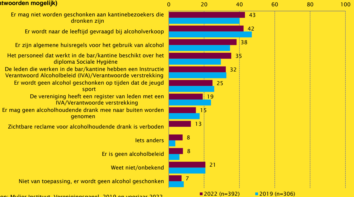
Figuur 2. Maatregelen voor verantwoord alcoholgebruik in verenigingskantines (indien van toepassing, in procenten, meerdere antwoorden mogelijk)