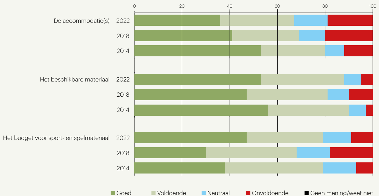
Figuur 1 Beoordeling van accommodatie(s), materiaal en budget voor LO volgens docenten LO in 2022 (n=334), 2018 (n=361) en 2014 (n=250, in procenten)

Hoe geven docenten invulling aan het volgen en beoordelen van hun leerlingen? Een thema waar al