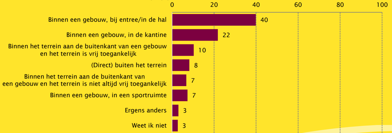
Figuur 2. Plekken waar de AED op de sportvereniging geplaatst is (in procenten, n=439)