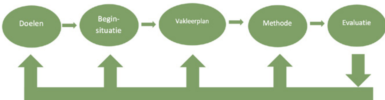
Figuur 1 Didactisch kader

Als schrijversgroep vinden wij het belangrijk om het geheel op basis van de regelthema's met regeltaken met uitgewerkte praktijkvoorbeelden te verduidelijken. Bij het opstellen hiervan werd goed duidelijk dat de regelthema's en regeltaken niet als op zichzelf staande methodische lijnen