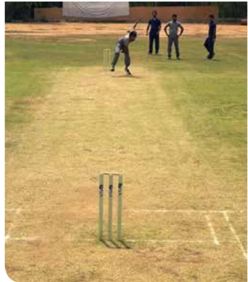
▲ Bowl Out

De wijze van bowlen en ook de afstand tot het wicket pas je aan de ervaring en het niveau van de spelers aan. Maak een keuze uit een onderhandse of bovenhandse aanworp waarbij je uitstapt of kies voor een strekwoorp vanuit