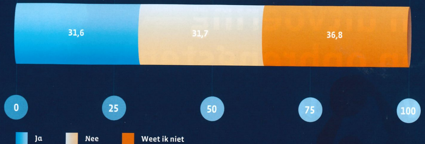
Figuur 3 Percentage gemeenten waar de uitbraak van het coronavirus van invloed is geweest op investeringen voor gemeentelijke sportaccommodaties, per type investering (meerdere antwoorden mogelijk, n=135)