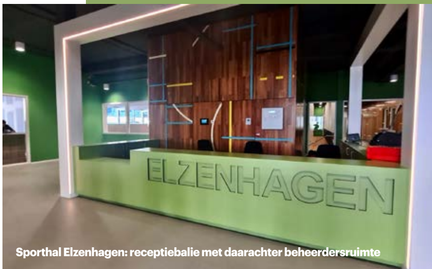
Sporthal Elzenhagen: receptiebalie met daarachter beheerdersruimte

Scholen hebben veelal een eigen kantine en aula. Sporthallen die 's avonds en in het weekend gebruikt worden door sportverenigingen en overdag voor bewegingsonderwijs, hebben bijna altijd een sportkantine. Voor het bewegingsonderwijs is het meestal niet relevant, maar de sportkantine zou gebruikt kunnen worden bij sportevenementen van scholen. Een sportkantine bestaat uit een verblijfsruimte (met een bar), een keuken, een magazijn, een koeling en een vriezer. Een leveranciersruimte is handig, zodat de leveranciers kunnen leveren en ophalen als het gebouw gesloten is. Een leveranciersruimte