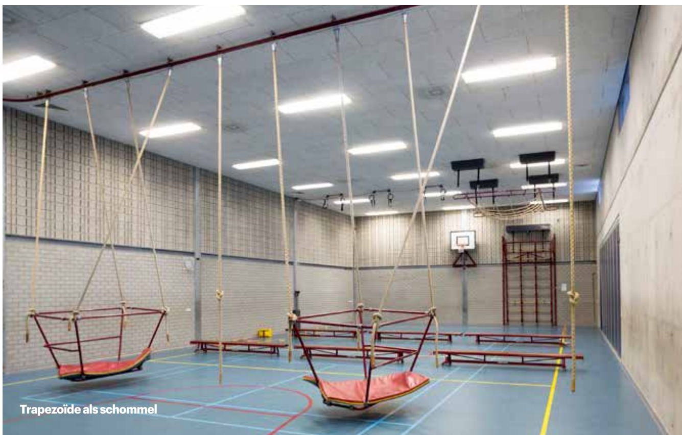
Trapezöide als schommel

schoolplan. Dat vormt de legitimatie voor je lessen.