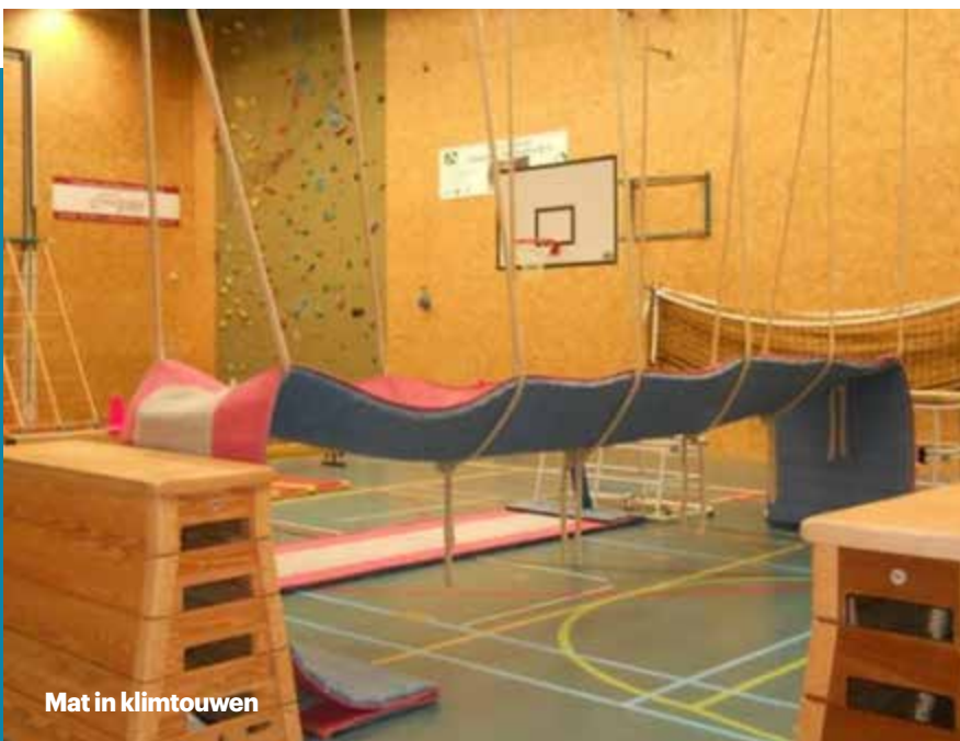
Mat in klimtouw

Alles uit de kast halen om leerlingen te boeien voor een gymles. Het lijkt erop dat leerlingen een steeds kortere spanningsboog hebben en er steeds iets nieuws geboden moet worden om ze actief te krijgen tijdens een gymles. Bij spectaculaire lessituaties neemt de kans op oneigenlijk