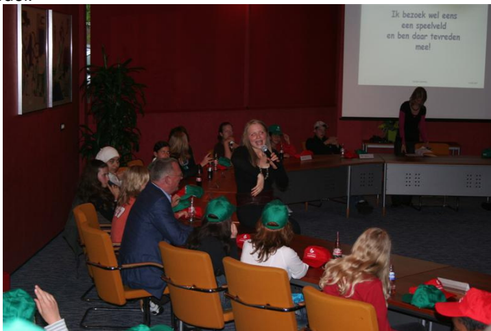
Foto van het Jeugddebate Leiderdorp op 10 mei 2007

Tot slot. De basisscholen worden gepolst of er behoefte is aan een kindergemeenteraad voor de groepen 7 à la Zoeterwouds model.