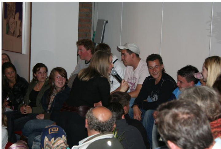
Foto van het Jeugddebate Leiderdorp op 10 mei 2007