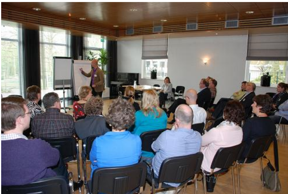
LEA conferentie in Amstelstroom

Het initiëren van samenwerking en afstemming tussen partners en het maken van dwarsverbanden met bijvoorbeeld de Lokale Educatieve Agenda (LEA) en de regio zijn een paar voorbeelden van taken. Daarnaast is ondersteuning in het veld, op uitvoerend niveau nodig om het CJG 'smoel' te geven. Activiteiten (zoals in de opvoedweek) dragen bij aan herkenbaarheid en maken duidelijk dat je ook bij het CJG terecht kunt met een (informatie-) vraag. Bijeenkomsten met het lokale veld leiden tot 'elkaar kennen' en daarmee vertrouwen wat bijdraagt aan betere onderlinge samenwerking. Lokale initiatieven van (zorg-)instellingen en/of opvoeders hebben ondersteuning nodig om tot bloei te komen. Naast zorgaanbieders als Vita welzijn en advies (jeugdmaatschappelijk werk) en Altra (schoolmaatschappelijk werk) maken ook kinderdagverblijven, het onderwijs, Coherente, de gezondheidszorg, sportverenigingen enzovoort deel uit van het lokale veld. Zij hebben direct of indirect contact met jeugd en hun opvoeders. Deze instellingen spelen een grote rol in het signaleren en kunnen bijdragen aan oplossingen.