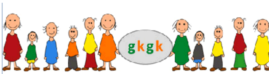
Figuur 2: Voorbeeld van een geslaagd preventief project: Gezonde Kinderen in een Gezonde Kindomgeving

Voorkomen is beter dan genezen. Steeds meer ligt de focus op het voorkomen van sociale isolatie, verslavingen of gezondheidsproblemen. Deelname aan sport- en beweegactiviteiten verkleint het risico op de genoemde problemen fors. Met programma's op maat, een goede publiciteitscampagne en het waarborgen van continuïteit kunnen sport- en beweegactiviteiten nog meer opleveren dan ze nu doen. De bevolkingssamenstelling van de regio Achterhoek is redelijk gelijk. Het is dus logisch dat er vergelijkbare interventies kunnen worden ingezet. Daarom is het voorstel om programma's die zich bewezen hebben breder in te zetten. Het resultaat kan dan vergroot worden, maar het wiel hoeft niet opnieuw uitgevonden te worden. Er zijn ervaringsdeskundigen aanwezig.