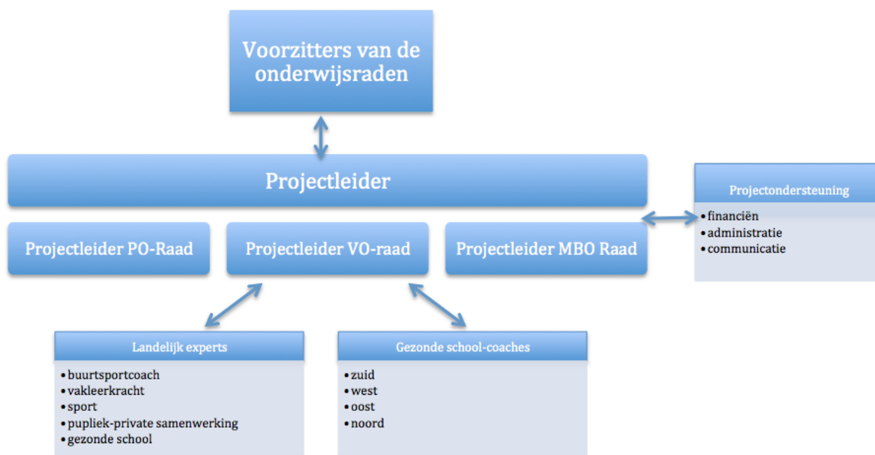
Figuur 2.1 Overzicht van de organisatiestructuur van de Onderwijsagenda SBGL

Deze vier adviseurs zijn elk werkzaam in een regio en sluiten aan op de 28 GGD regio's. Zie figuur 2.1 voor een overzicht van de organisatiestructuur van de Onderwijsagenda SBGL.