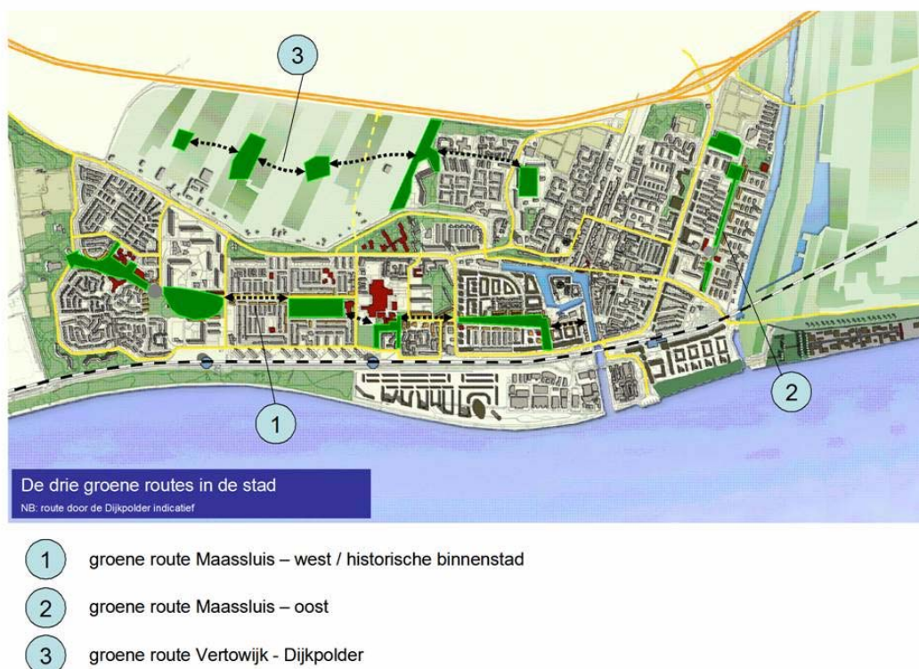
Figuur 3 groene routes in Maassluis

Maassluis zet in op versterking van de verbindende structuren in de stad (Ruimtelijke Structuurvisie). In het bijzonder wordt bedoeld de groene routes in de stad. Nadruk komt te liggen op het versterken en bevorderen van de langzaamverkeersverbindingen in en langs deze route en de collectieve sociaal, maatschappelijke functies, die zoveel mogelijk langs of in relatie tot deze route ontwikkeld cq gehandhaafd moeten worden.