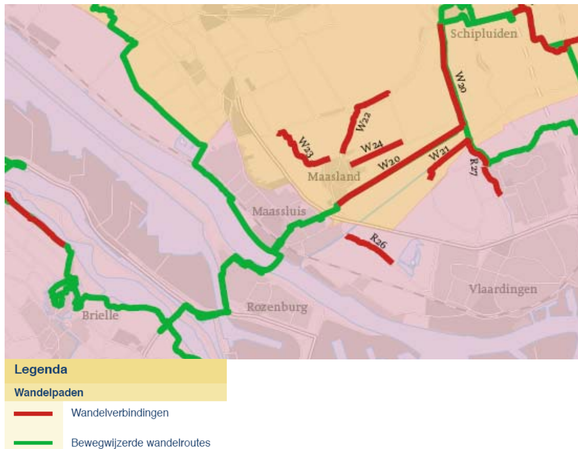
Figuur 2 Wandelpaden (omgeving) Maassluis