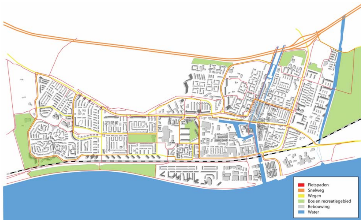
Figuur 4 Recreatie in Maassluis

De mate waarin recreatiegebieden binnen de stad aanwezig zijn, is bepalend voor de (directe) leefomgeving van de inwoners. Over het algemeen hebben we het dan over het aanwezige groen. Groen dat gebruikt wordt voor recreatie is van essentieel belang voor de stad. De gemeente Maassluis hanteert het standpunt dat groen openbaar moet blijven en te allen tijden zijn functie kan blijven vervullen. In het Groenstructuurplan Maassluis wordt e.e.a. nader aangegeven.