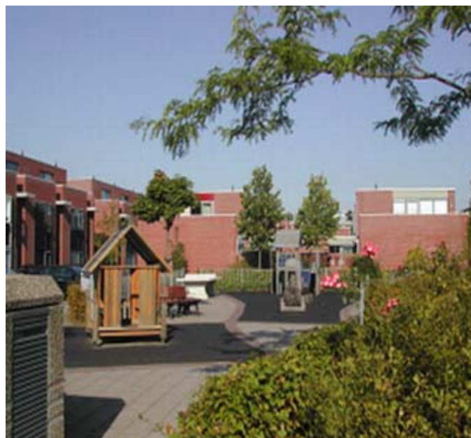
Buurtspeelplek Simon van Beaumontstraat

Instandhouden van speelplekken staat of valt bij medeverantwoordelijkheid dragen door omwonenden. Sociaal toezicht, melden van schade of meedenken in verbeteringen zijn een garantie voor een goed functionerende openbare ruimte. Dergelijke houding verdient een goede steun en spreekwoordelijke pluim.