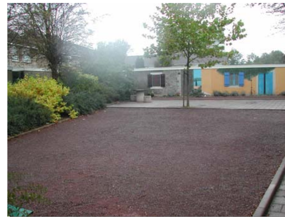
Jeu de boules (ouderen)

Gemeente Middelburg Dienst Ruimte Afdeling Ingenieursbureau Augustus 2006