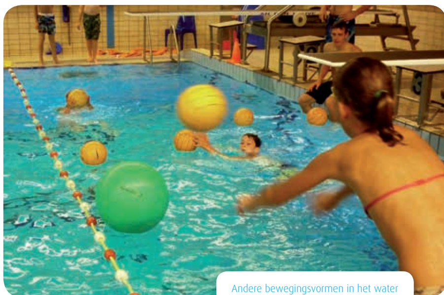
Andere bewegingsvormen in het water

Slootveilig geeft aan dat de deelnemer in en om het huis zich moet kunnen redden, dat wil zeggen in ondiep (tot schouderhoogte) water. De termen laten zien welke vaardigheden de leerlingen beheersen. >>