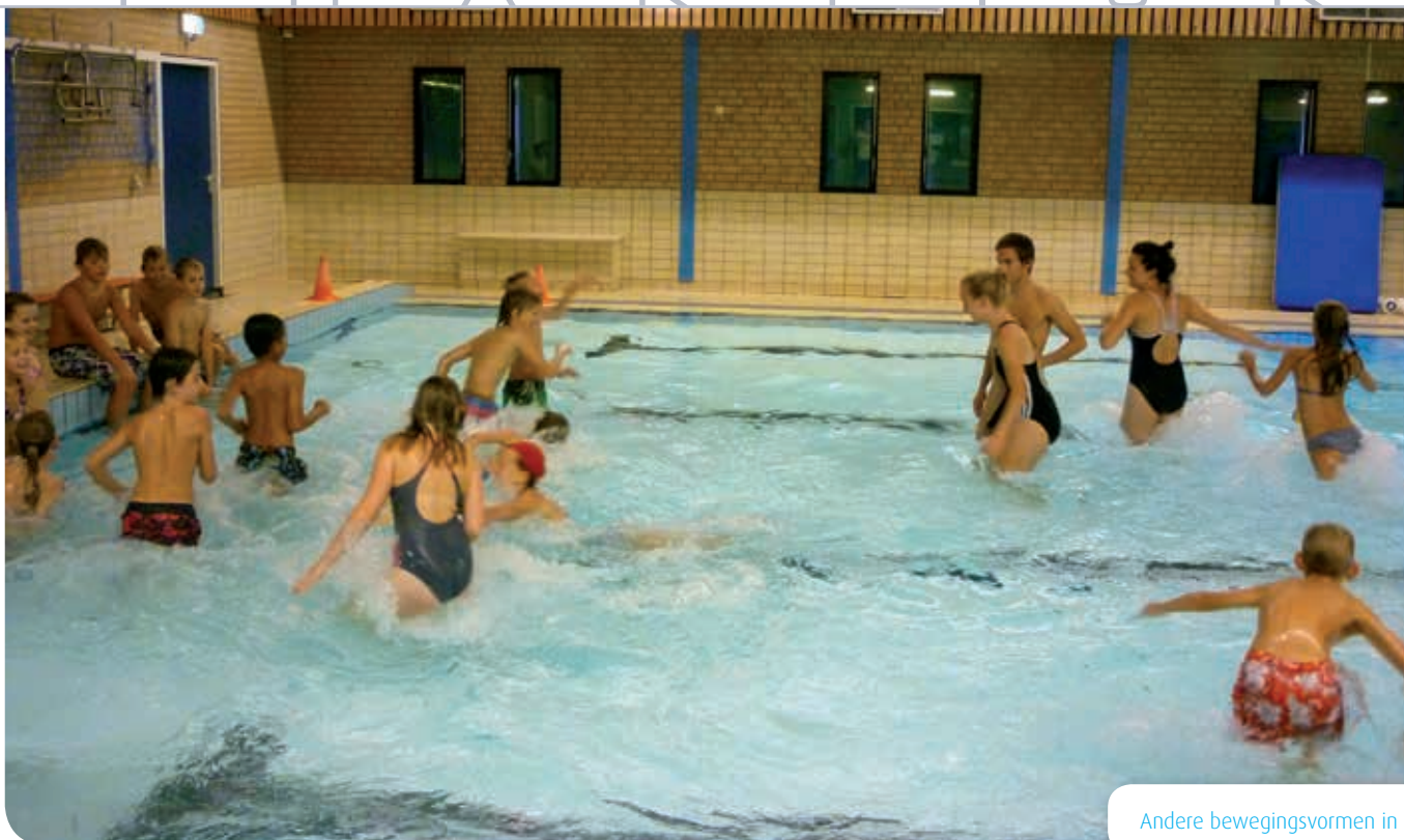
Andere bewegingsvormen in het water

Voor de zomer- en winterperiode zijn drie niveaubeschrijvingen beschreven.