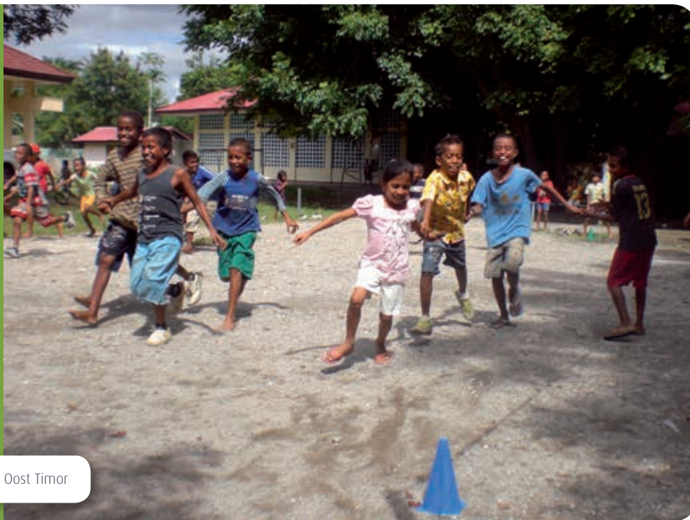
Plezier op Oost Timor

De commissie formuleerde vier pilaren als de fundering van het onderwijs: