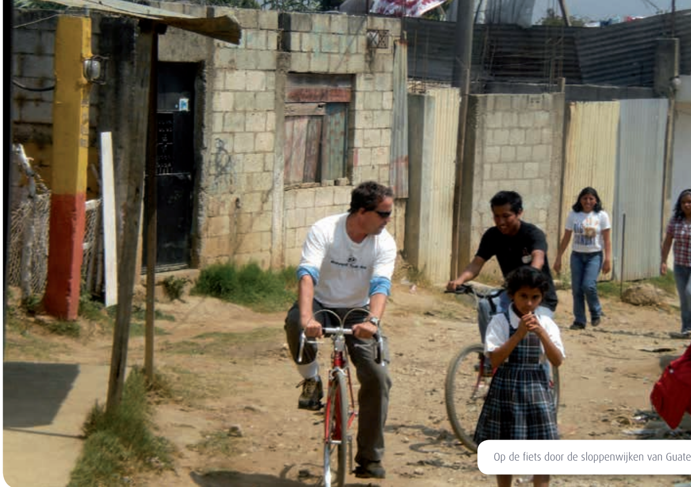
Op de fiets door de sloppenwijken van Guatemala stad