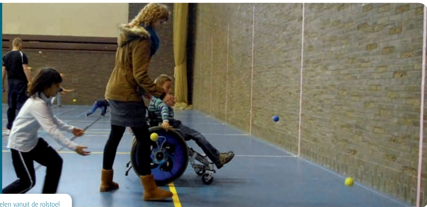
Ook te spelen vanuit de rolstoel

In het vorige artikel ( Lichamelijke Opvoeding 6 ) hebben we uitgelegd hoe One Wall