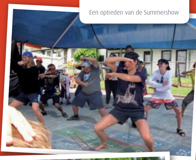
Een optreden van de Summershow