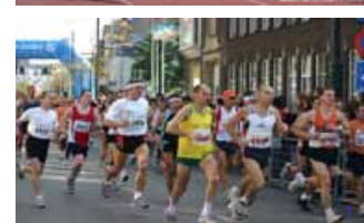
Figuur 3. Voorbeeld Gezond en Vitaal aan het werk – persoonlijk profiel