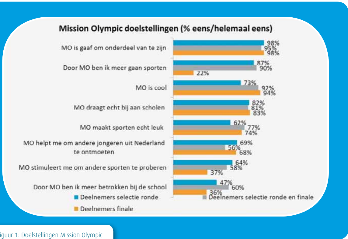
Figuur 1: Doelstellingen Mission Olympic

13 Procent van de Nederlandse jongeren in de leeftijd 12 tot 19 jaar kent Mission Olympic. Zodra jongeren bekend zijn gemaakt met Mission Olympic, bijvoorbeeld via een filmpje, worden ze