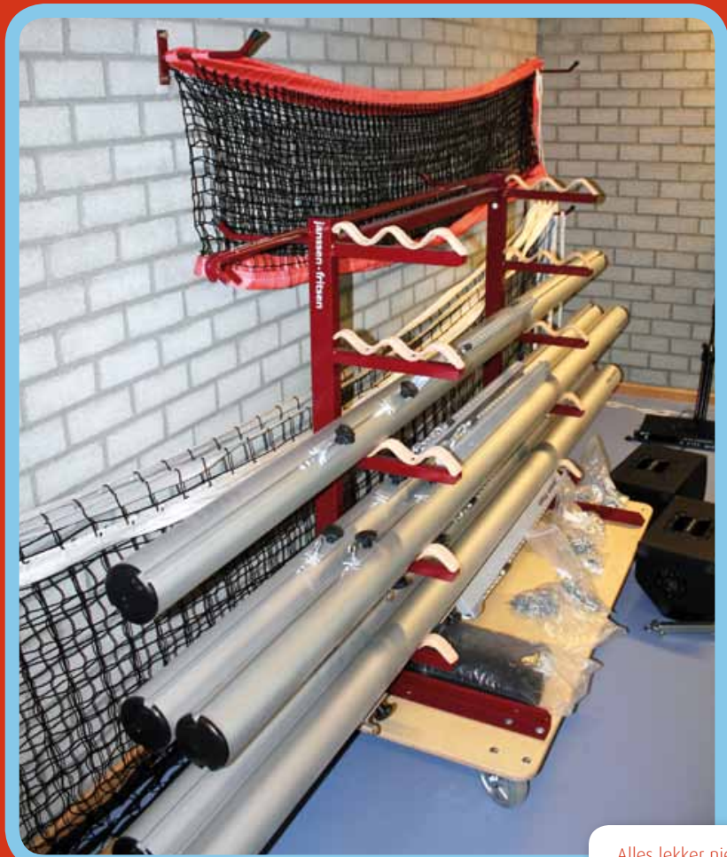
Alles lekker nieuw