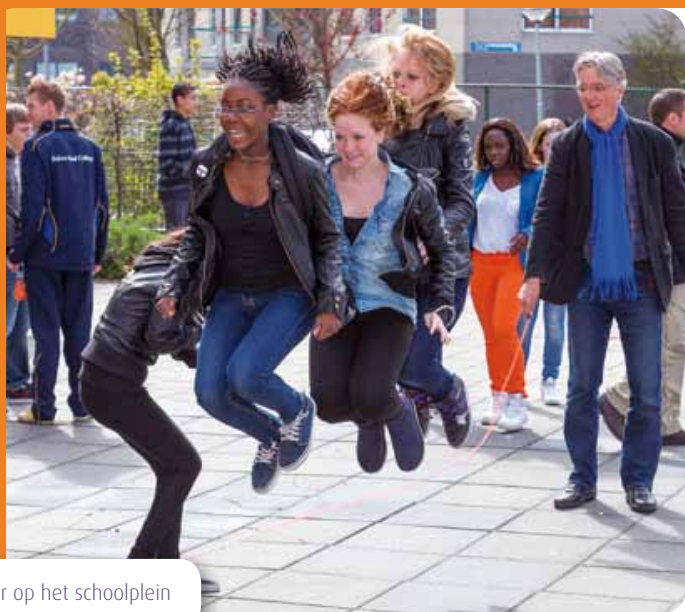
Plezier op het schoolplein

en worden uitgebreid met nieuwe scholen. De sport- en beweegcoördinatoren in mijn regio willen in elk geval nog bij elkaar blijven komen, minimaal een keer per jaar. Ze zijn en blijven erg benieuwd naar de ideeën en plannen van elkaar.”