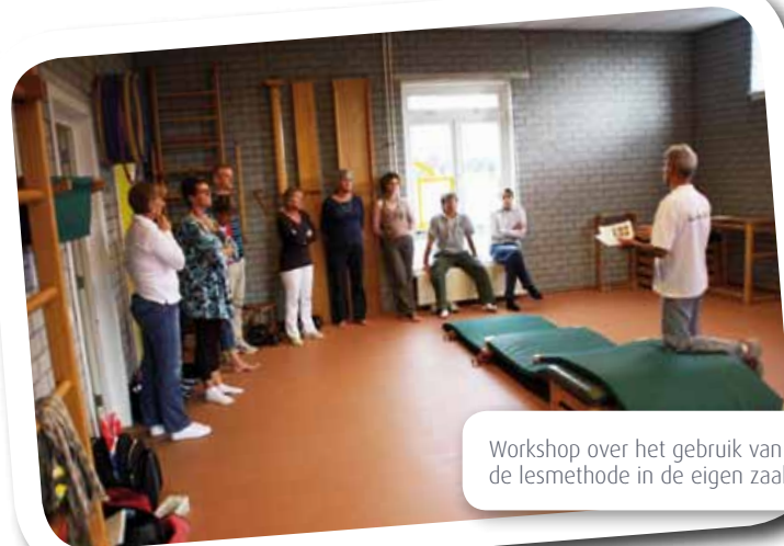
Workshop over het gebruik van de lesmethode in de eigen zaal

den gebruikt. Wij juichen de aanstelling van goed opgeleide professionals die zich inzetten voor de zorg voor de motorische ontwikkeling van kinderen op elke school van harte toe. De praktijk leert helaas dat op veel scholen onvoldoende expertise en/of formatieruimte aanwezig is om deze zorg te organiseren. Met dit lessenspakket menen wij een bijdrage te leveren aan de oplossing van dit veel voorkomende probleem.