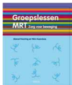
Cover 'Groepslessen MRT-zorg voor beweging'

Om dit lessenpakket te kunnen gebruiken, is het geen vereiste veel ervaring te hebben in het geven van lessen in bewegingsonderwijs. De lessen stoelen op een duidelijke methodiek die door leerkrachten en andere professionals verantwoord kan wor-