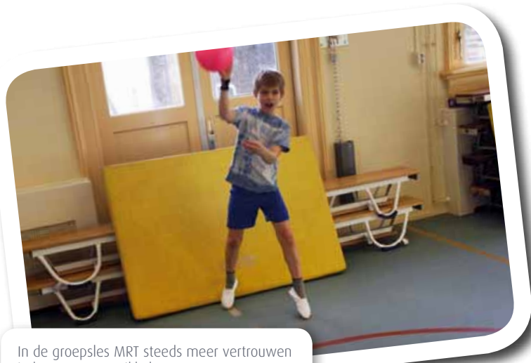
In de groepsles MRT steeds meer vertrouwen in bewegen ontwikkelen