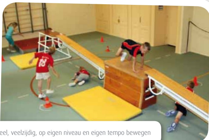
Veel, veelzijdig, op eigen niveau en eigen tempo bewegen