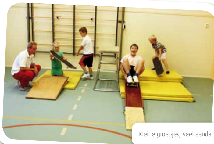
Kleine groepjes, veel aandacht